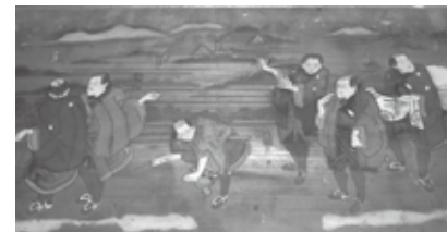
伊勢参詣図(堀工町 熊野神社)