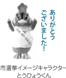
市選挙イメージキャラクター とうひょうくん