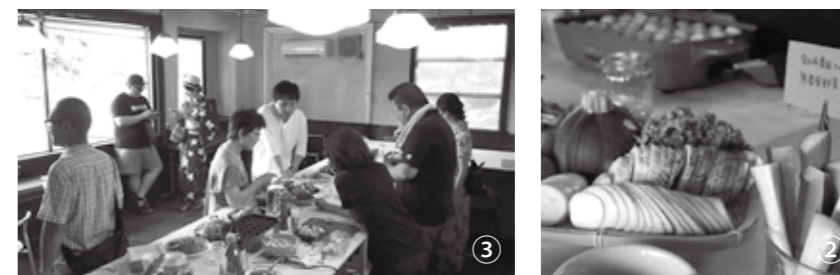
①実験的取り組みとしてビアパーティーを開催。これからもイベントなどを行いながら、オープンを目指していくそう／②③自分たちで作ったカウンターに、協力して作った料理が並ぶ。メンバーの個性や強みを生かし、協力して完成させた