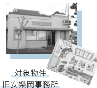
対象物件 旧安楽岡事務所

街に明かりを灯したい。空き家や空き店舗が増え、活気がなくなってきた街に賑わいを取り戻したい。リノベーションスクールをきっかけに、そんな思いで動き出したのが、「三手家守舎」そして「TATEBAYASHI PUBLIC HOUSE」です。このグループは、遊休不動産のオーナーと創業をめざすプレーヤーをつなぎ、空き家や空き店舗に再び「明かりを灯す」ことを目的とする「三手家守舎」の法人化、また、その「三手家守舎」が直営する、館林の食・文化・情報を集めたアンテナスペース「TATEBAYASHI PUBLIC HOUSE」のオープンをめざして活動しています。