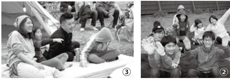
①来場者は、夜空の下、開放的な雰囲気の中で映画鑑賞を楽しんだ。②地域の子どもたちも楽しく設営に協力。みんなで作り上げたイベントだ。③プロジェクトのメンバーらは、自分たちでつくりあげたくつろぎの空間が完成すると自然と笑顔に