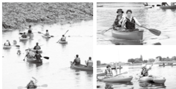
尾曳駐車場東岸からつつじ岡公園渡船場にかけてのコースを試走。今回は茂林寺沼で試走を行い、さらに検討を重ねながら事業化をめざす

本市では、日本遺産である里沼と沼辺文化をいかしたまちづくりを進めるとともに、水に親しむことで、水質改善の意識も高められるよう、今後もさまざまな事業を展開していきます。