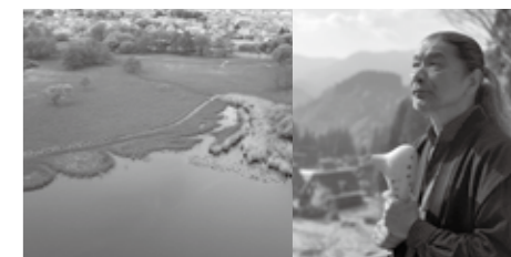
宗次郎さんの美しいオカリナの演奏が、分福茶釜の茂林寺がある茂林寺沼（祈りの沼）の幻想的な光景を連想させる

時間 午後6時30分～8時30分 出演 ■能 「葵上」下平克宏（シテ方観世流能楽師） ■オペラ 大山亜紀子・塚田孔右（群馬音楽協会）、群馬交響楽団アンサンブル ■ゲスト 宗次郎（オカリナ奏者） 入場料（全席指定） 3,000円