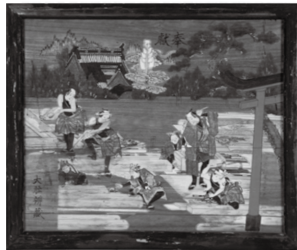
江戸時代に奉納された「大工絵馬」 足次町 赤城神社