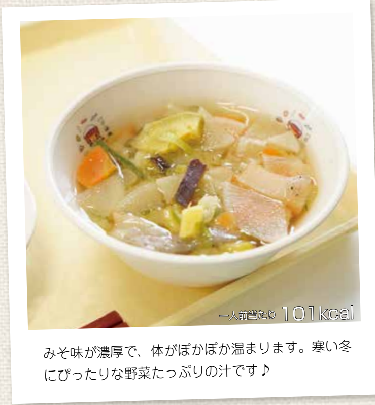
みそ味が濃厚で、体がぽかぽか温まります。寒い冬にぴったりな野菜たっぷりの汁です♪

鹿児島県を代表する郷土料理の「さつまい」。さつまいとは、さつまい鶏を使うことに由来していると伝えられ、江戸時代に行われていた闘鶏で、負けた鶏を野菜と一緒に煮込んで食べたのが始まりと言われています。