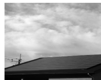
10kW以上の太陽光発電設備は償却資産の申告対象です(写真:住宅の屋根置き型太陽光パネル)

固定資産税は土地や家屋だけでなく、事業用で所有している構築物、機械・装置、工具・器具・備品などの償却資産にも課税されます。 市内に償却資産を所有するかたには、12月中旬に申告書類一式を発送しますので、令和2年1月1日現在の資産の状況など、必要事項を記入して、期限までに提出してください。申告書類が届かない場合でも、