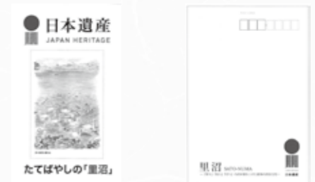
日本遺産「里沼」ポストカード