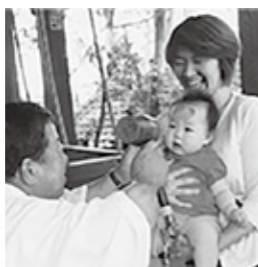
写真右)毎年5月31日・6月1日に行われる「初山」の様子

「富士原の浅間塚」は富士山を模した浅間塚（富士塚）で、毎年山開きに当たる5月31日・6月1日に、乳児の額に朱印を押し健やかな成長を願う「初山」が、山仕舞いに当たる9月1