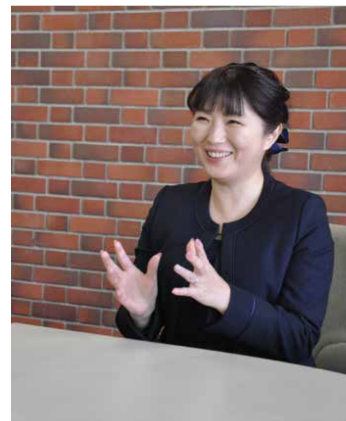
エンディングノートは愛のメッセージ