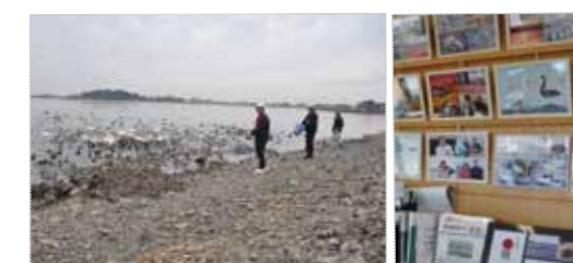
会員たちが給餌をしている様子(写真左)。野鳥観察棟には会員が撮った写真がずらりと並んでいる。訪れた人に白鳥についての説明も行っている(写真右)

profile 昭和15年3月、台宿町に生まれる。定年退職後は、地域活動を積極的に行っている。地元の仲間とのゴルフも楽しみのひとつ。高校時代に出会った奥様とは年に2～3回の旅行に出かける。健康の秘訣は毎日30分のウオーキングと晩酌。