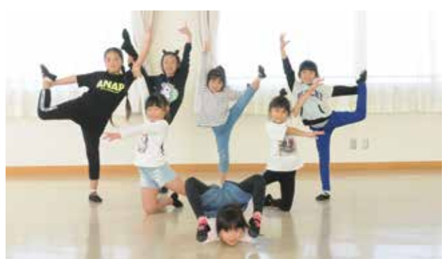
Fairy ☆ (フェアリー)