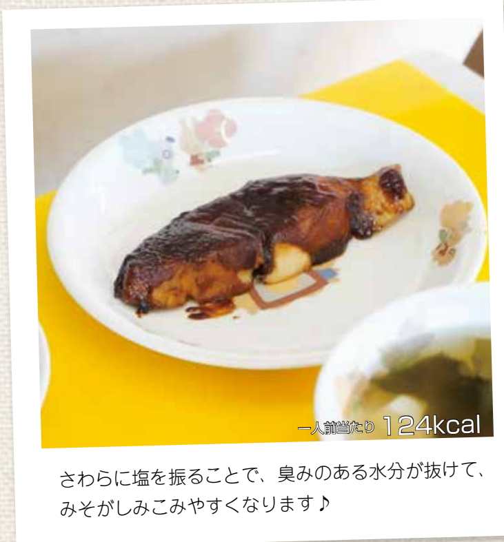
さわらに塩を振ることで、臭みのある水分が抜けて、みそがしみこみやすくなります♪

さわらはくせのない上品な白身魚で、合わせみそを塗ることでよりおいしくなります。DHAが豊富で良質のたんぱく質、ビタミンB2が多く、栄養価の高い食材で、子どもたちの人気メニューの一つです。