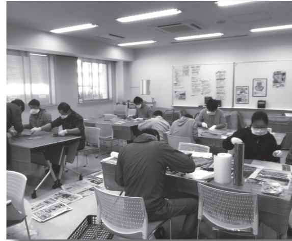
宇都宮大学での資料保全活動の様子(令和元年11月17日)

昨年10月12日から13日にかけて関東地方を襲った台風19号(令和元年東日本台風)によって、隣の佐野市では秋山川が氾濫し、2700棟以上が浸水し、400人以上が避難しました。浸水したある民家では、個人収集の軍事関係資料が水損しました。幸い神戸大学の歴史資料ネットワークが駆けつけ、被災資料を宇都宮大学に運び込むことができました。