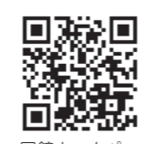
同館ホームページ2次元コード

※内容により、別途実費負担がある場合があります 申込み コースごとに下図の日程で同館ホームページへ 問合せ 同館(☎75-1515)