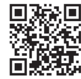
同館ホームページ2次元コード

直接向井千秋記念子ども科 学館へ 申込み 4月12日(日)の午前9時から、同館ホームページへ ※電話や来館、1人で複数組の申し込みはできません ※詳しくは同館ホームページをご覧ください