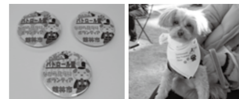
特製缶バッジ(左)とバンダナを身につけた修了生(右)

ドッグトレーニング教室第4期生の修了式が、2月22日、Sugar Hill Cafeで行われました。今期から、教室修了生に対し、犬の散歩中に身につけられる特製缶バッジとバンダナが交付されました。これは、散歩や庭作業などをしながら日常生活の中で子どもたちの安全を見守る「ながら見守りボランティア」の一環として、飼い犬と散歩しながら防犯パトロールの協力をお願いするものです。教室を修了した18匹は、オリジナルグッズを身につけた「わんわんパトロール隊」として、飼い主のかたの協力のもと、地域の安全を支えています。 問合せ 地球環境課環境保全係 (内線 452)