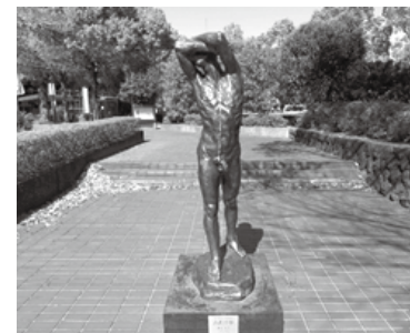
(上)「ああ青春」(1962年制作) 2005年 市役所正面入口設置 第5回日展・文部大臣賞受賞 (左)「光は大空より」(1965年制作) 1979年 文化会館西側設置 第8回新日展・日本芸術院賞受賞