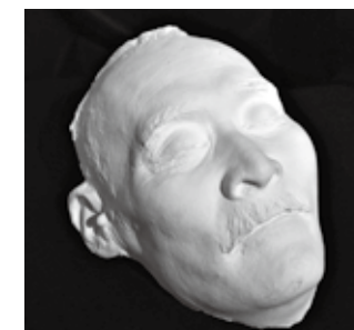
花袋のデスマスク(石膏製) 花袋が亡くなった翌日にとられたもの

開催期間 7月12日(日)まで延長 展示解説会 6月7日(日)、7月5日(日) 午後2時～(30分程度)