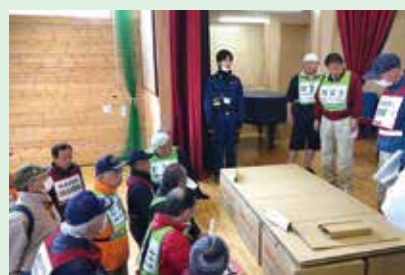
避難所開設訓練の様子（第二小学校）

新型コロナウイルス感染症拡大を防ぐため、咳エチケット、手指衛生などの徹底と、避難所を利用する場合は、マスクの着用をお願いします。