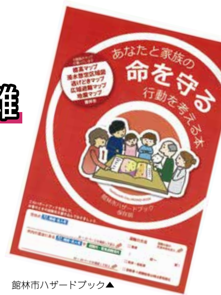
館林市ハザードブック▲

警戒レベルとは、水害に備えて皆さんがとるべき行動を市がお知らせする避難情報です。ハザードブックでお住まいの地域の浸水想定区域（浸水深）などを確認し、災害の危険性を把握したうえで、ご自身の避難行動について検討してください。