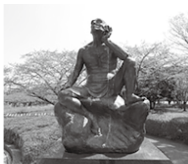
(上)「月と語る」(1964年制作) 2008年 ふれあい橋たもと設置 (左)「古橋選手の像」(1949年制作) 2007年 ダノン城沼アリーナ前 (城沼総合体育館)設置