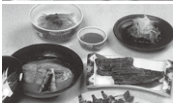
市内には川魚料理店が多く、多種多様な料理を楽しめます