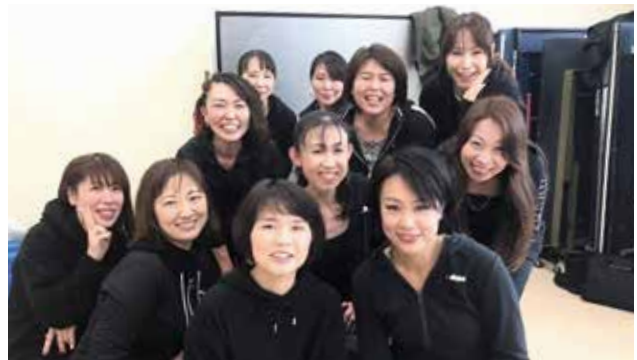
fun fun マミーズ