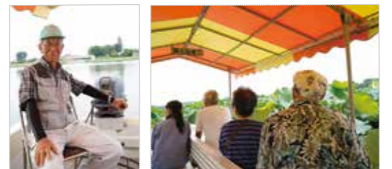
50歳の時に2級小型船操縦免許を取得し操縦はお手のもの（写真左）。県内外や外国人の乗船客への名物ガイドも今年は残念ながら感染防止のため自粛（写真右）

profile 昭和18年12月、当郷町に生まれる。公務員時代はさまざまな地域に勤務し、東海村原発の最前線に従事していた経歴も。趣味の書道では気づくと一日中書写に熱中。あまりの集中ぶりに筆を握っているとき、家族は声をかけづらいとか。