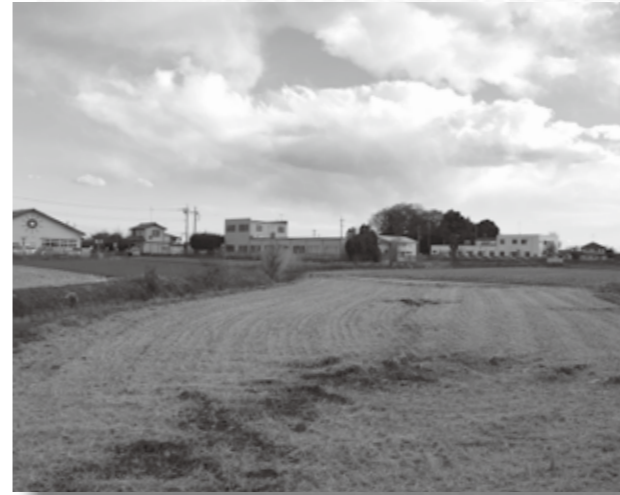
現在確認できる矢場川の旧河道 (渡瀬公民館付近)

館林市街地の台地から渡良瀬川の間には、渡良瀬低地と呼ぶ広大な平野が広がります。この低地の大きな特徴は、昔の渡良瀬川(矢場川)の河道が地形として残っていることです。大地に刻まれた過去の川筋を旧河道といえます。 渡良瀬低地の旧河道は、木戸町の西から高根町の北方を廻り、足次町の西側(写真参照)を南下して渡瀬駅付近で大きく蛇行し、大新田へ東流して細内町・