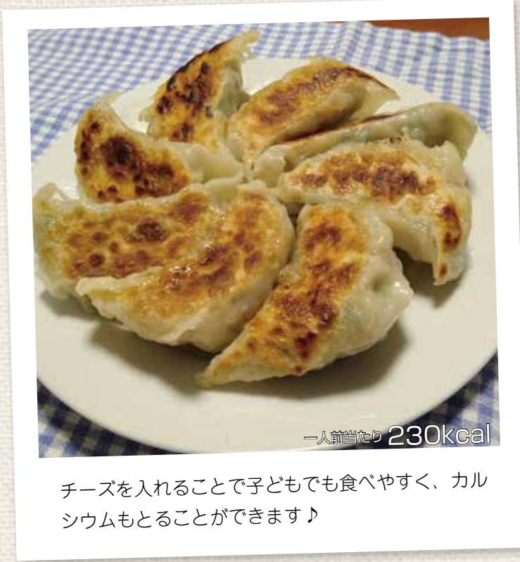
チーズを入れることで子どもでも食べやすく、カルシウムもとることができます♪

ビタミンCやカリウムが豊富に含まれるニガウリを使った、夏にぴったりの一品です。ニガウリが苦手な方は、みじん切りにしたニガウリを塩もみすると食べやすくなります。ぜひ試してみてください！