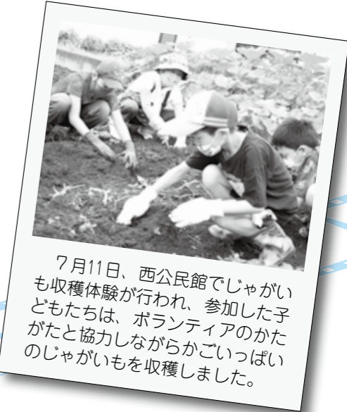
7月11日、西公民館でじゃがいも収穫体験が行われ、参加した子どもたちは、ボランティアのかたがたと協力しながらかごいっぱいじゃがいもを収穫しました。