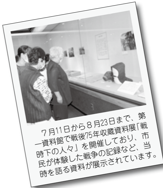
7月11日から8月23日まで、第一資料館で戦後75年収蔵資料展「戦時下の人々」を開催しており、市民が体験した戦争の記録など、当時を語る資料が展示されています。