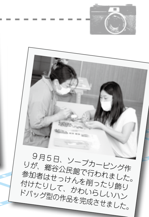
9月5日、ソーブカービング作りが、郷谷公民館で行われました。参加者はせっけんを削ったり飾り付けたりして、かわいらしいハンドバッグ型の作品を完成させました。