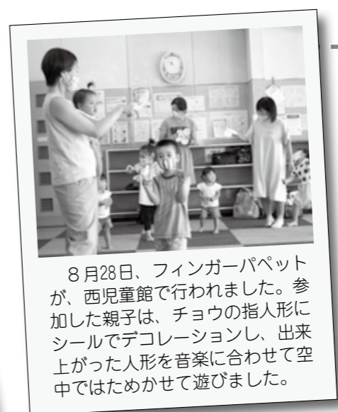
8月28日、フィンガーパペットが、西児童館で行われました。参加した親子は、チョウの指人形にシールでデコレーションし、出来上がった人形を音楽に合わせて空中ではためかせて遊びました。