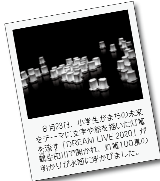
8月23日、小学生がまちの未来をテーマに文字や絵を描いた灯籠を流す「DREAM LIVE 2020」が鶴生田川で開かれ、灯籠100基の明かりが水面に浮かびました。