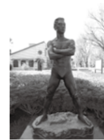
(上)「玄潮」(1948年制作) 2006年 三の丸芸術ホール設置 (左)「新泉」(1971年制作) 2006年 市役所議会議棟前設置