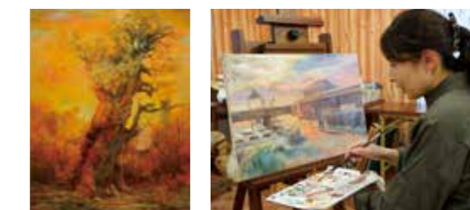
繊細な色使いの中に力強さを感じる屋久杉。油彩絵具だけでなく、和紙や植物なども貼り付けている(写真左)。制作中の作品はお子さんが通う保育園(写真右)

profile つつじ町に生まれる。画家だった父親の影響で高校生から絵の勉強を始める。「第19回上野の森美術館大賞展」で『鳥空間—さまよい—』が絵画大賞を受賞。主に動物や魚を題材にした作品を制作。近頃は市内の風景や消防士の作品も手掛ける。