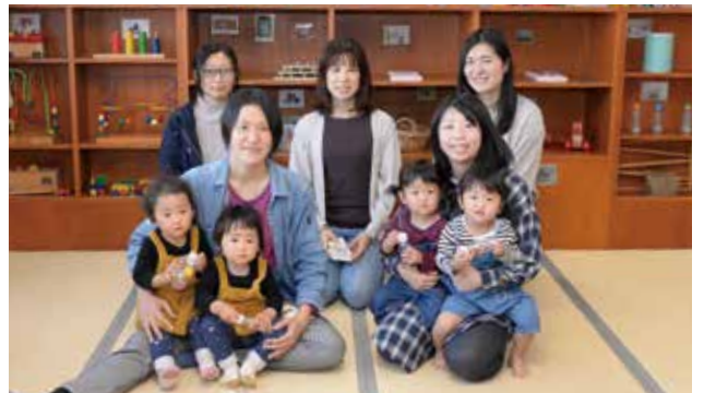
さくらんぼサークル