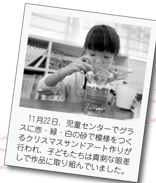
11月22日、児童センターでガラスに赤・緑・白の砂で模様をつくるクリスマスサンドアート作りが行われ、子どもたちは真剣な眼差しで作品に取り組みしていました。