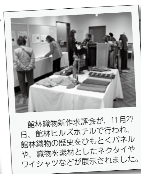
館林織物新作求評会が、11月27日、館林ヒルズホテルで行われ、館林織物の歴史をひもとくパネルや、織物を素材としたネクタイやワイシャツなどが展示されました。