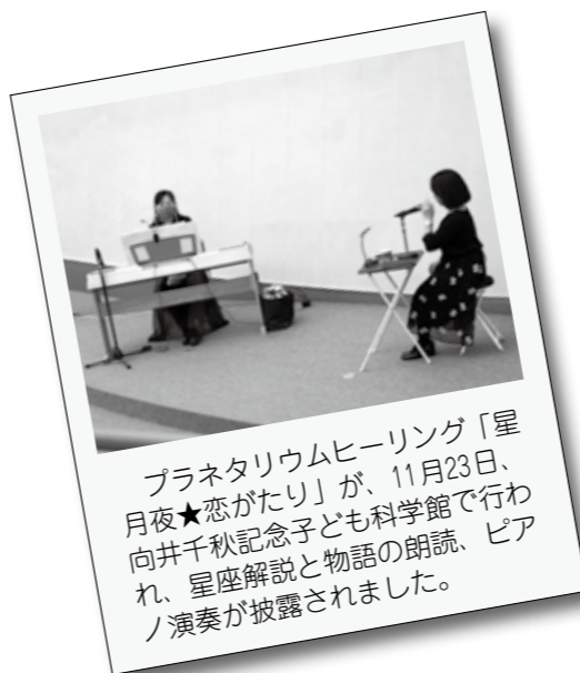
プラネタリウムヒーリング「星月夜★恋がたり」が、11月23日、向井千秋記念子ども科学館で行われ、星座解説と物語の朗読、ピアノ演奏が披露されました。