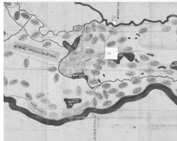
寛文上野国絵図(邑楽郡域抜粋) (酒井家資料、前橋市立図書館蔵)