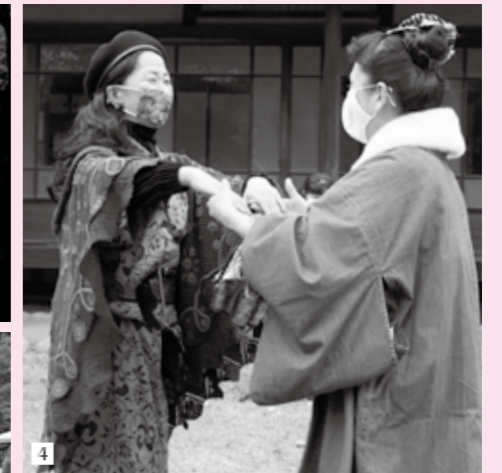
1 照らし出される旧秋元別邸 / 2 竹灯籠にもあたたかな光が灯る / 3 家族連れの憩いの場となった / 4 ライブ演奏の軽快な音楽に合わせて