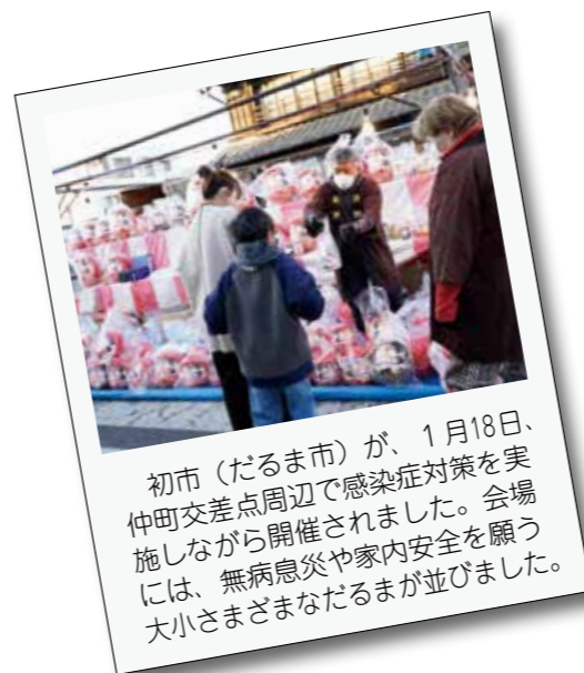
初市(だるま市)が、1月18日、仲町交差点周辺で感染症対策を実施しながら開催されました。会場には、無病息災や家内安全を願う大小さまざまなだるまが並びました。