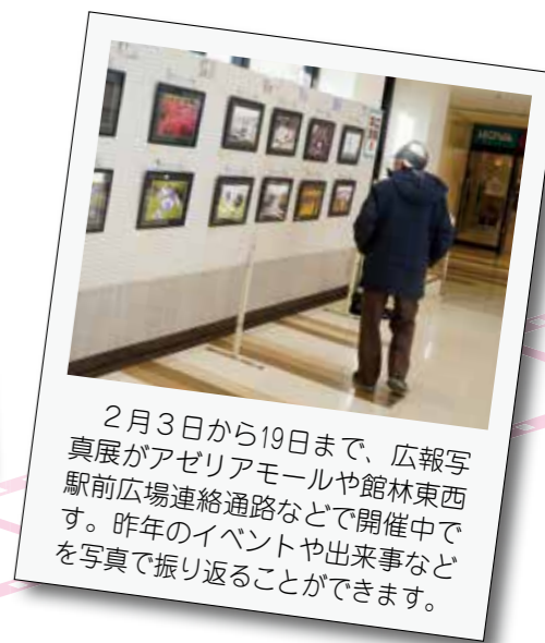
2月3日から19日まで、広報写真展がアゼリアモールや館林東西駅前広場連絡通路などで開催中です。昨年のイベントや出来事などを写真で振り返ることができます。