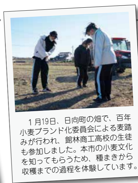
1月19日、日向町の畑で、百年小麦ブランド化委員会による麦踏みが行われ、館林商工高校の生徒も参加しました。本市の小麦文化を知ってもらうため、種まきから収穫までの過程を体験しています。