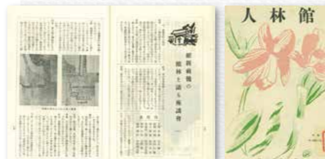
『館林人』創刊号 表紙と記事 「維新前後の館林を語る座談会」