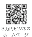
3万円ビジネスホームページ

又はEメールで商工課商業振興係 (TEL 47-5147) ☒shoko@city.tatebayashi.gunma.jp) < 6回連続講座 とき 7月30日(金)、8月20日(金)、9月7日(火)・28日(火)、10月7日(木) 11月上旬に実施予定 定員 12人(申し込み多数の場合は選考) 参加費 1万5000円(教材費など) 申込み 7月16日(金)までに同商業振興係 (TEL 47-5147) へ ※連続講座は日程や会場などを変更する場合があります 共通事項 問合せ 同商業振興係