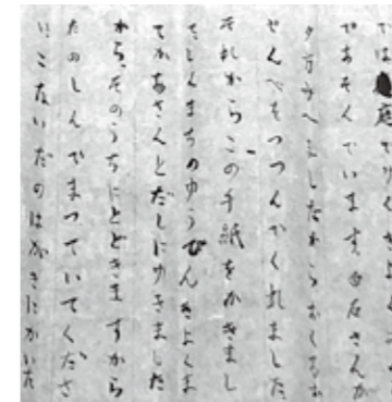
花袋宛田山先蔵書簡 部分