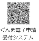
ぐんま電子申請受付システム

申込み 6月5日(土)の午前9時から、ぐんま電子申請受付システムへ 問合せ 文化振興課日本遺産推進係 (TEL 71-4111)