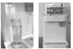
マイボトル 給水スポット

皆さん、こんにちは! 「たてばやし5つのゼロ宣言」を勉強中のゼロ子です。早速ですが、皆さんは給水スポットをご存じですか? プラスチックごみゼロにつながる取り組みのひとつで、マイボトルで館林市の美味しい水を飲めるものです。ぜひとも味わってみたい! と思い調べると、一部の公民館や小・中学校に設置されているとのこと。実際に行ってきました。