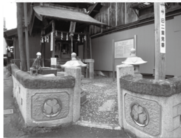
別当福寿院が廃止された清瀧神社(清瀧宮) (本町二丁目)

江戸時代以前には神と仏は一体であり、仏こそが神の本性と考えられてきました。その時期の神社は、一般的に別当寺という寺院によって運営されました。館林城下でも、愛宕社(木挽町)には興蔵寺、長良社(代官町)には天福寺、青梅天神社(谷越町)には宝幢寺、清瀧宮(肴町)には福寿院、太神宮(新紺屋町)には加納院が別当寺と設定され、神社の祈禱などを行いました。小規模な神社でも別当寺が設定され、その多くは神社と境内を