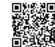
グルメサイト 2次元コード

申込み・問合せ 電話又はメールで館林市観光協会(つつじのまち観光課内 Tel.74 - 5233、 kankou@utyututuji.jp )へ