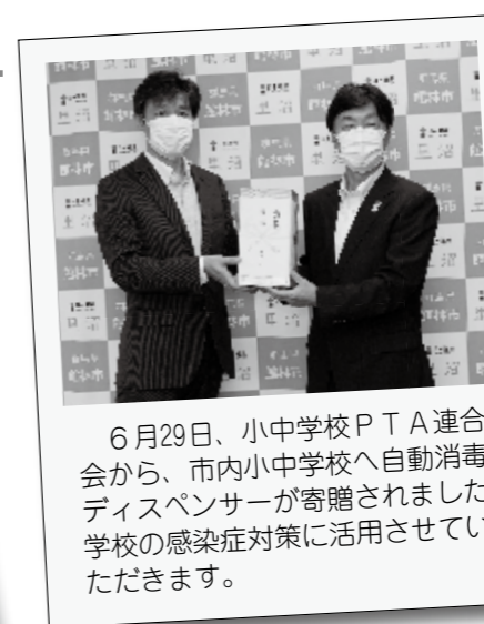
6月29日、小中学校PTA連合会から、市内小中学校へ自動消毒ディスペンサーが寄贈されました。学校の感染症対策に活用させていただきます。