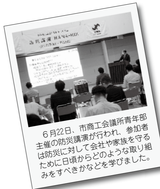
6月22日、市商工会議所青年部主催の防災講演が行われ、参加者は防災に対して会社や家族を守るために日頃からどのような取り組みをすべきかなどを学びました。