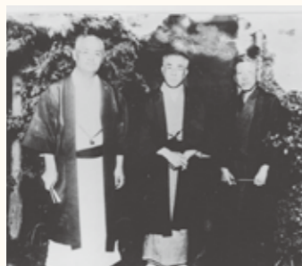
左から、花袋、藤村、徳田秋声 (大正13年7月)

今回の企画展では、3期に分けて藤村の手紙を全て展示し、両者の交友や文壇的足跡について、関連資料とともに紹介します。