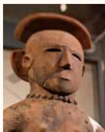
女子像埴輪 (天神二子古墳出土)

期間 7月2日(土)～9月11日(日) 時間 午前9時～午後5時(入館は午後4時30分まで) 展示解説 7月3日(日)、8月7日(日) 午前11時～(約30分) 入館料 無料