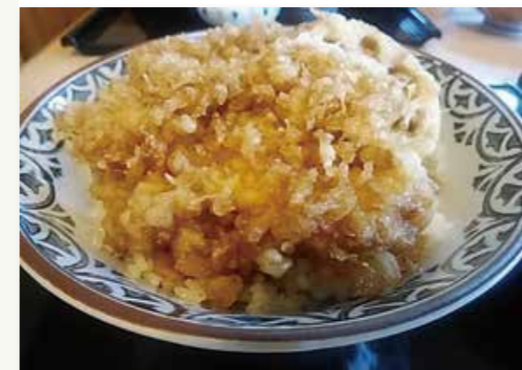
川魚料理店で提供されるナマズ丼

館林は複数の沼が魅力ある景観を創り出しています。この「里沼」は日本遺産に認定されています。景観の魅力だけでなく、味覚の魅力もあります。里沼のある地域らしく川魚料理店も多く、川魚グルメの町と言われています。いつでも川魚の味覚を満喫できます。主力商品は、夏が近づくと鰻の蒲焼きです。