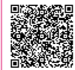
ぐんま電子申請受付システム