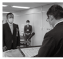
令和3年12月17日に開催した顕彰式の様子

意見書提出先 2月21日(月)必着)までに、縦覧場所に備え付けの様式、又は必要事項(氏名、住所、利害関係、意見要旨)を記入したものを直接、又は郵送で同工務係(☎374-8501 市役所内)へ