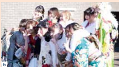
3456 人生の節目に、同級生と最高の笑顔で