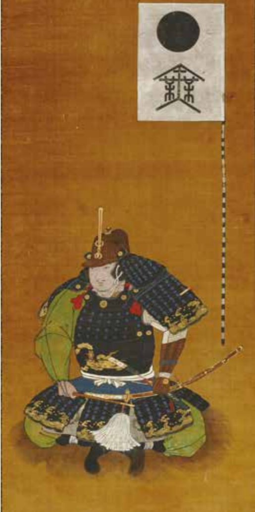
神原康政像(東京国立博物館所蔵) 国指定重要文化財

善導寺の現在地への移転に伴い、昭和59年(1984)に行われた発掘調査で、康政の墓から遺骨が確認されました。四肢骨の太さや骨質の厚さから、頑丈な骨格であったと考えられています。