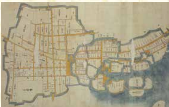
大給松平氏時代の館林城絵図(西尾市教育委員会所蔵)

現存する館林城絵図の中で最も古い、神原氏の後に藩主となった大給松平氏時代の城絵図。