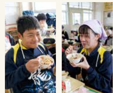
2月10日の第三中学校の給食の様子