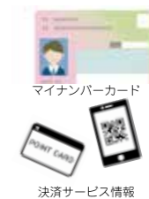
マイナンバーカード