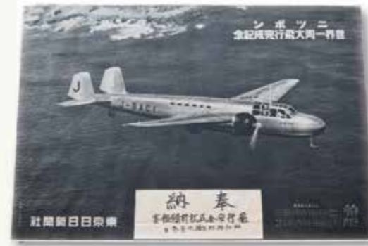
「ニッポン」世界一周記念奉納額 尾曳稲荷神社（尾曳町）所蔵

羽田に帰着しました。飛行距離5万2860km、飛行時間194時間でした。昭和12年の同じく国産機「神風」の東京・ロンドン間飛行（朝日新聞社）に次ぐ快挙に、日本中が大きく沸き立ち、記念誌や絵はがき・詩・歌などが作られました。「ニッポン」はヨーロッパ各国も回る計画でしたが、9月1日のドイツのポーランド侵攻によって予定を変更、南欧三国訪問にとどまりました。このように、時代は世界戦争への道を進んでいました。「ニッポン」も、海軍の九六式爆撃機（中攻）と呼ばれたものを改装したものです（「神風」は陸軍機）。同爆撃機は日中戦争では重慶などへの爆撃に使用されてきました。 この奉納額には、「飛行安全成就祈願報賽」と書かれた紙片が付されています。安全祈願がかなえられたことへのお礼の意味です。どなたか関係者が館林に住んでいたのでしょうか。