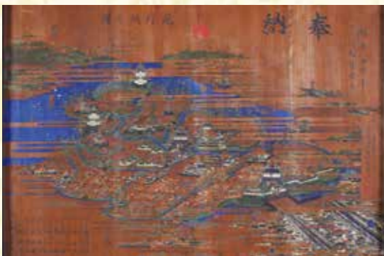
館林城絵馬(尾曳稲荷神社所蔵) 市指定重要文化財

現存する館林城絵図の中で最も古い、神原氏の後に藩主となった大給松平氏時代の城絵図。