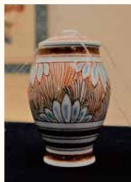
榊原康勝の骨壺(複製)

昭和60年(1985)の善導寺移転に伴う発掘調査で、榊原康勝の墓石の下から発見された骨壺です。康勝は、テレビなどでも再注目されている徳川四天王・榊原康政の子で、2代目館林藩主を務めた人物です。元和元年(1615)の大坂夏の陣の帰り道、病を患い京都で亡くなりました。出土した骨壺の高さはおよそ10cmととても小さく、中には康勝の下あごと歯の骨と見られるものが入っていました。資料館では、この骨壺の複製品を1階に展示していますので、ぜひ間近をご覧ください。