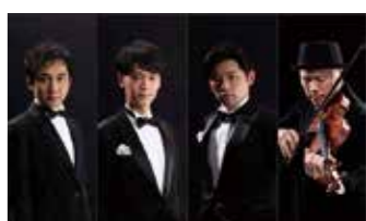
歌声カルテット クラシック歌手とピアノ・バイオリン奏者で構成され、クラシックから唱歌、歌謡曲、ポップスまで幅広い名曲を質の高いパフォーマンスでお届けする、実力派のカルテットグループ。