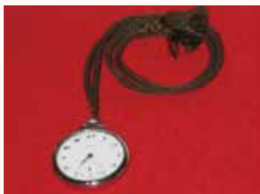
田山花袋記念文学館（Tel74-5100）

田山花袋は懐中時計を使用しており、文学館では当時の懐中時計を展示しています。「旅」が好きだった花袋が肌身離さず持ち歩いた懐中時計。昔の時代に思いをはせる一品です。