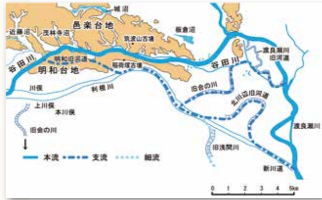
6世紀中～末の河道変遷を示した図

谷田川は、邑楽郡千代田町木崎地内から明和町を経て、板倉町海老瀬で渡良瀬川へ合流する延長20km余の一級河川で、本市と三町との境界でもあります。入ヶ谷町より上流は利根川低地を流れますが、青柳町から下流は邑楽台地と明和台地の間にできた幅500m前後で、台地より2mほど低い「谷田川谷」の中をゆるく蛇行しながら流れます。