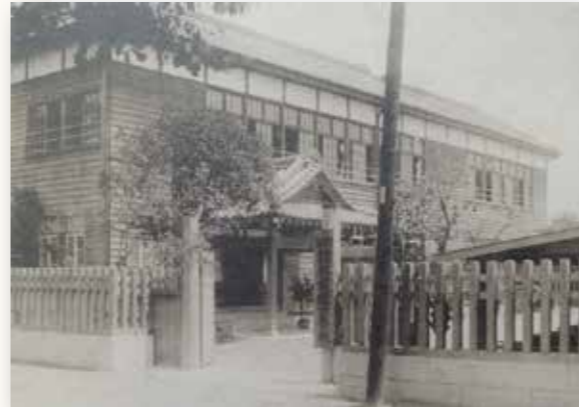
昭和10年(1935) 館林裁縫女学校

現在では、学校や教育はとも身近なものです。でもそれは、多くの人びとが力を尽くしてきたからこそ身近になったものでした。明治になって始まった近代的な教育制度は、当初はなかなか普及せず、特に女子への教育は普及が遅れました。それでも、まずは小学校、次いで中学校卒業後に裁縫などを教える教育機関と、徐々に女子教育の機会は広がっていききました。