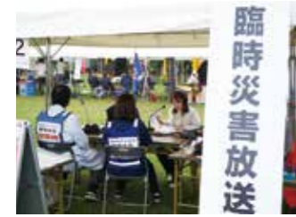
令和6年度市総合防災訓練 臨時災害放送局訓練の様子

地震などの大規模な災害時に、市民への情報発信を行う臨時災害放送局(FMラジオ放送)の運営ボランティアを募集します。 応募資格 次の全てに該当するかた ■市内在住の18歳以上 ■臨時災害放送局が開設されたときに協力できる 募集人数 20人程度 申込み・問合せ 秘書課(TEL47-5101)へ