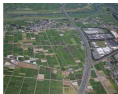
館林大島地区

市長就任後、ブルドッグソース㈱が埼玉県川口市から大新田町に移転し、生産や研究開発などの機能を集約した新棟を建設の上、昨年1月に本格稼働しました。また3月には、大手コンビニエンスストアの総菜を製造する㈱虎昭産業が栃木県佐野市から北成島町に移転し、稼働開始しました。今後造成が開始する大島工業団地にも全国から優良企業を誘致し、税收確保と雇用創出、本市のさらなる成長のため、引き続き職員の先頭立ってトップセールスを行ってまいります。