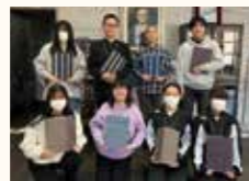
田山花袋記念文学館朗読プロジェクト参加メンバーと館林軸の台本

とき 3月16日(日) 午後2時開演(午後1時30分開場) ところ 日清製粉ウェルナ三の丸芸術ホール