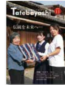
広報紙部門（市の部） 第二席