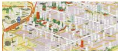
＜花の都 上州館林大観（部分）＞