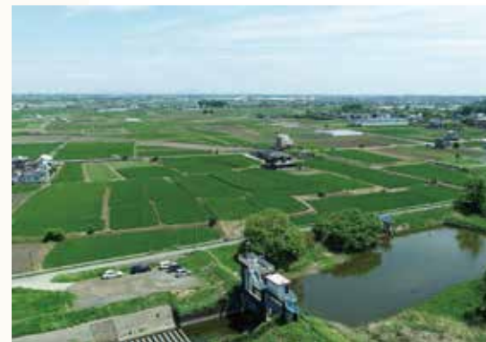
現在の渡良瀬低地の景色(木戸町より東を望む)

今年の夏は、記録的な異常高温でした。9月は例年なら秋霖と大型台風による雨の季節です。台風や線状降水帯という、水害、土砂災害といったマイナスイメージしかありませんが、実は、日本の平野は洪水が作ったのです。