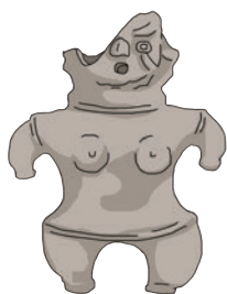
A. 土偶 どぐう