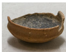
A. 土師器 はじき