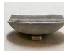
B. 須恵器 すえき