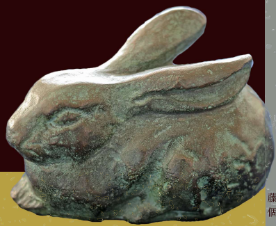
藤野天光 <ウサギ> 個人蔵