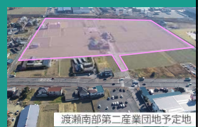
渡瀬南部第二産業団地予定地