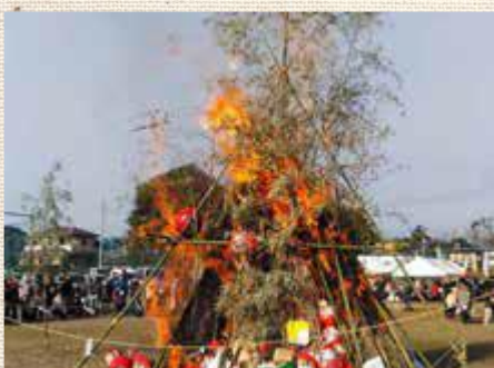
堀工町のどんと焼き