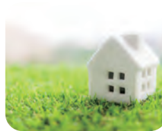
空き家の管理・処分