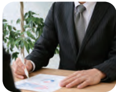
葬儀後の手続き相談