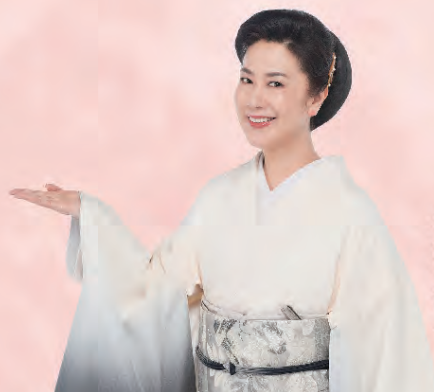
全優石イメージキャラクター 名取裕子