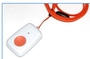
ペンダント型送信機