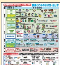
資源とごみの分け方・出し方

「資源とごみの分け方・出し方」、「分別収集カレンダー」などのリーフレットやスマートフォン用「資源とごみ分別アプリ さんあ〜る」のチラシを、ご希望の方に印刷、配布しています。市のホームページからもダウンロード可能です。地域での正しいごみ出し啓発にぜひ、ご利用ください。