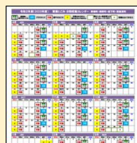
分別収集カレンダー