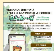
資源とごみ分別アプリ さんあ〜る