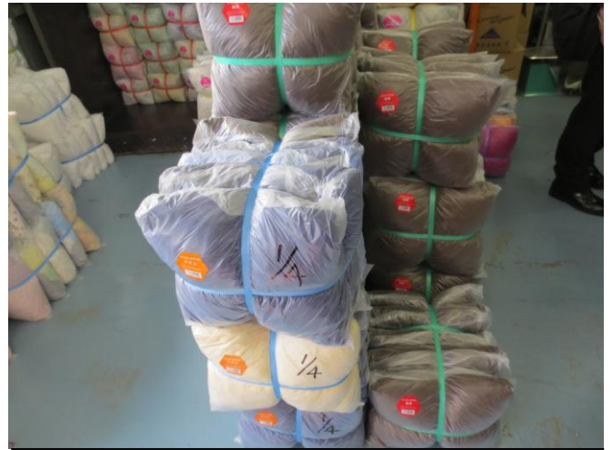
ウエス（雑巾・モップ等）として使用されます