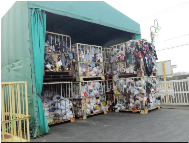
自治体及び回収業者から集められた古着・古布