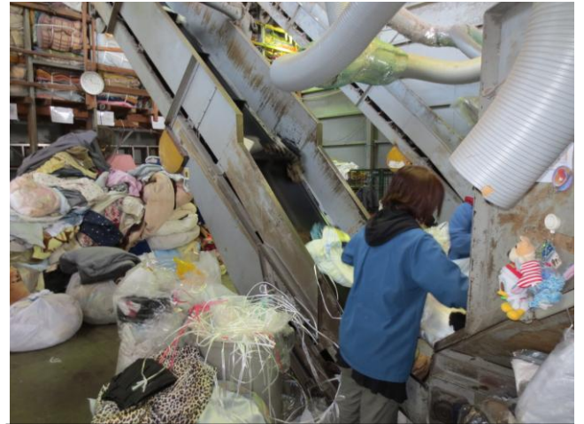
ビニール类等異物の除去作業