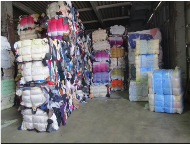
主に東南アジア等に輸出され再利用されます