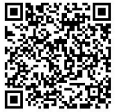
乳幼児突然死症候群 (SIDS) について