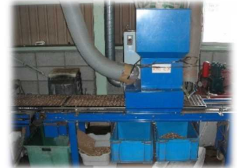
セル成型苗用全自動播種機