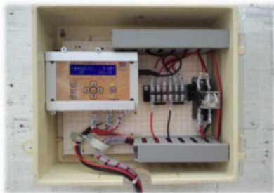
自動かん水装置 (群馬県開発 トマト、キャベツ)