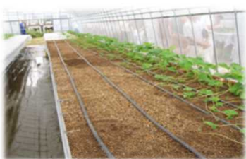
地域開発型いちご 簡易高設栽培・育苗システム