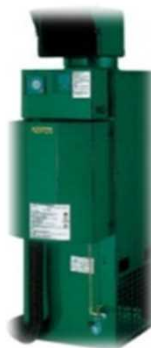
二酸化炭素施用装置*4