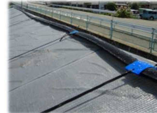
屋根散水装置(群馬県開発) *3