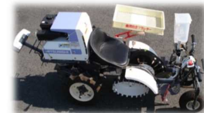
移植同時粒剤植穴施用装置 (群馬県開発)