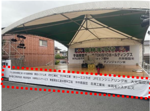
C : まつり本部及び特設ステージ下段幕