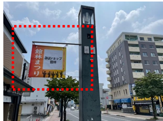
D : 街路灯フラッグ