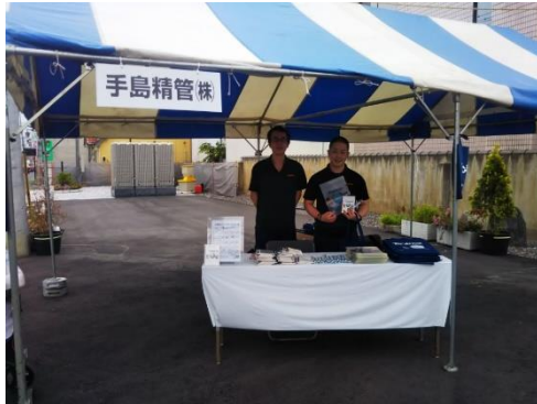
A : PR ブース