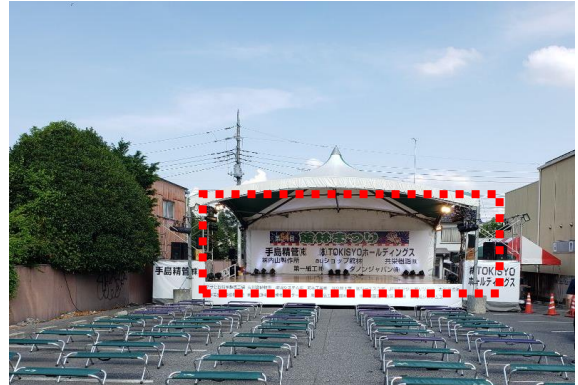
B : 特設ステージ上バックパネル