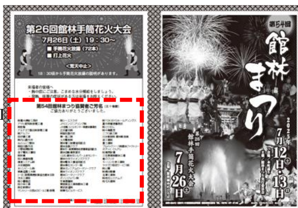
F : チラシ