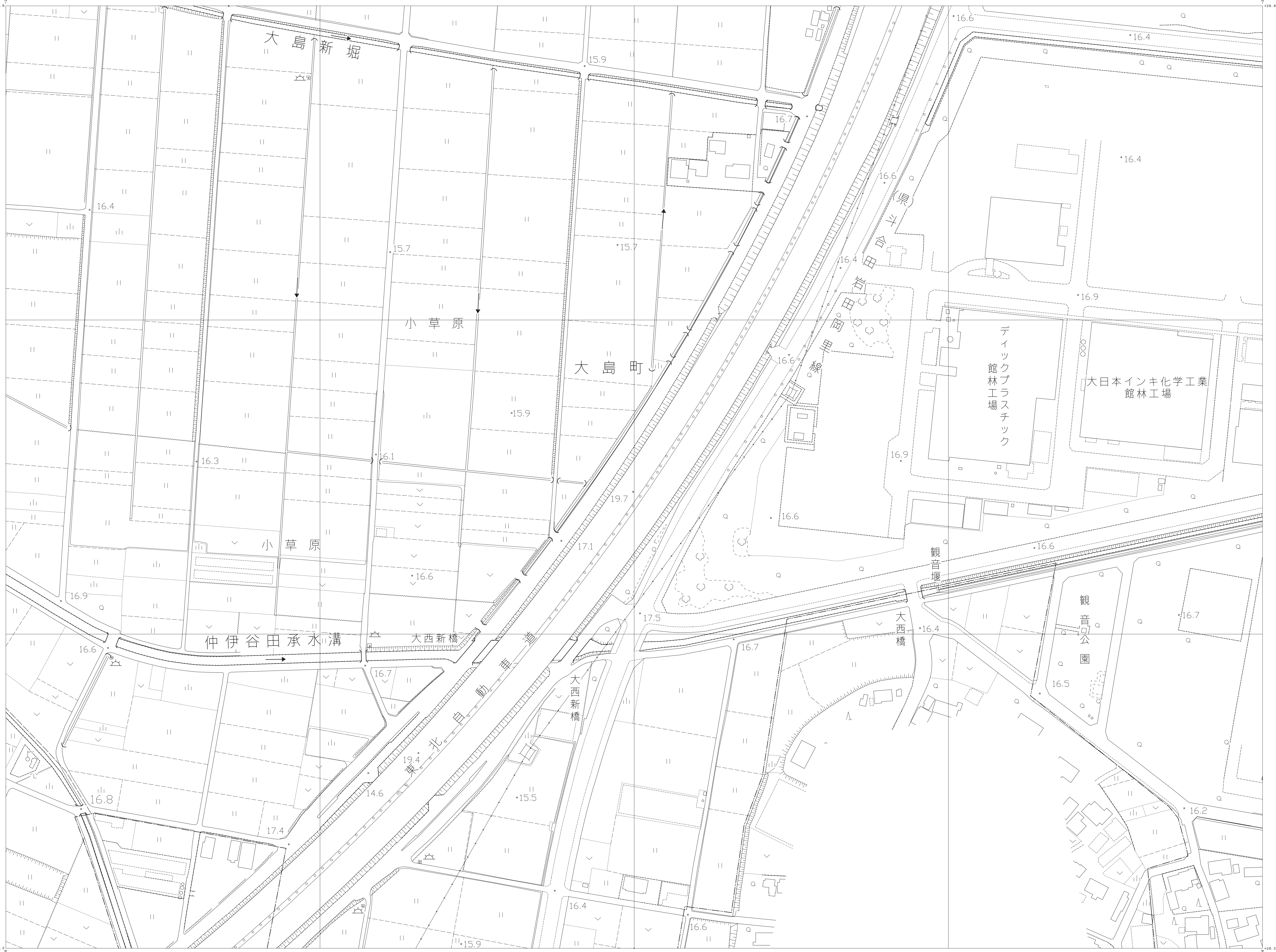
館林市都市計画図 63