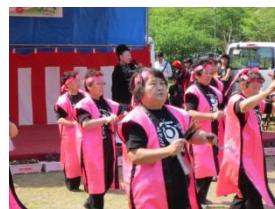
五家英子みんなで楽しく踊ろう会