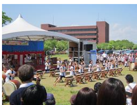
青柳児童クラブ和太鼓