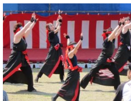
よさこいソーラン「華艶舞」