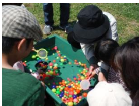
スーパーボールすくい