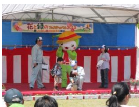
JA 邑楽館林野菜クイズ