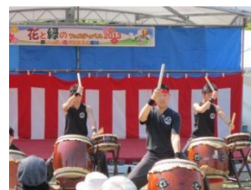
関東学園大学付属高校和太鼓部