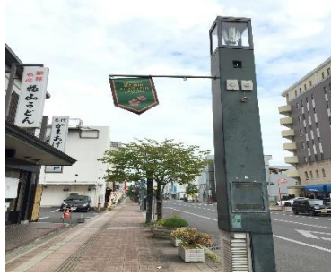
花と緑のフェスティバルフラッグ