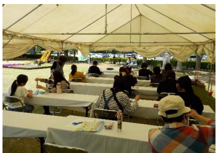
ハーバリウム教室