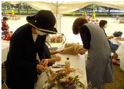
カーネーションのスワッグ教室