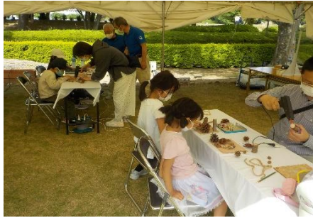
親子で遊ぶ「遊工房」