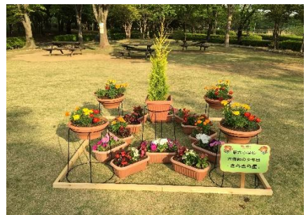
緑の少年団フラワーガーデン