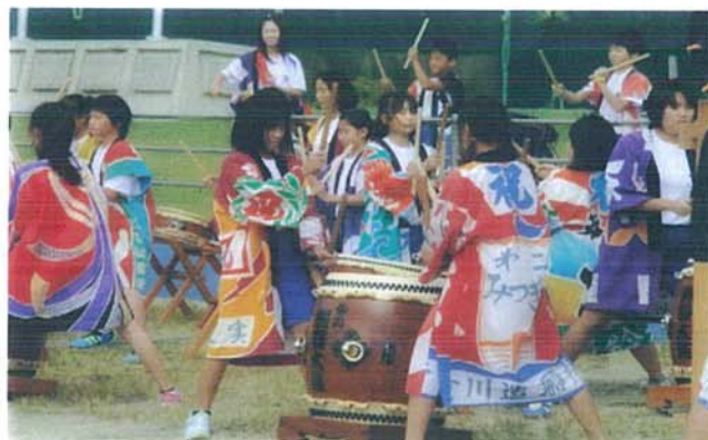
【6年生・秋刀魚収穫祭出演】