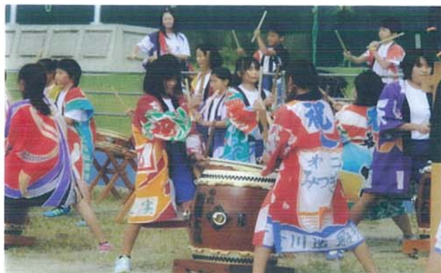
【6年生・秋刀魚収穫祭出演】