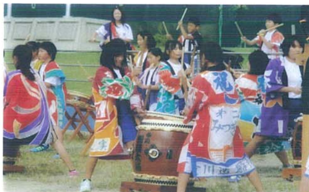
【6年生・秋刀魚収穫祭出演】