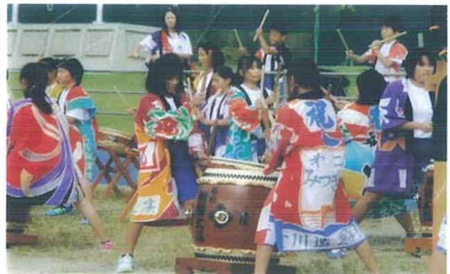
【6年生・秋刀魚収穫祭出演】