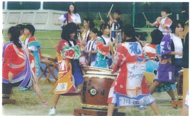
【6年生・秋刀魚収穫祭出演】