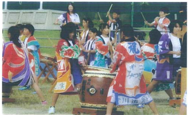
【6年生・秋刀魚収穫祭出演】