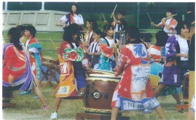
【6年生・秋刀魚収穫祭出演】