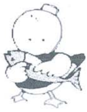
【シーバル～女川町キャラクター】