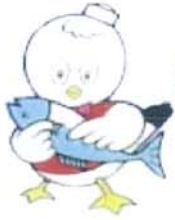
【シーバル〜女川町キャラクター】