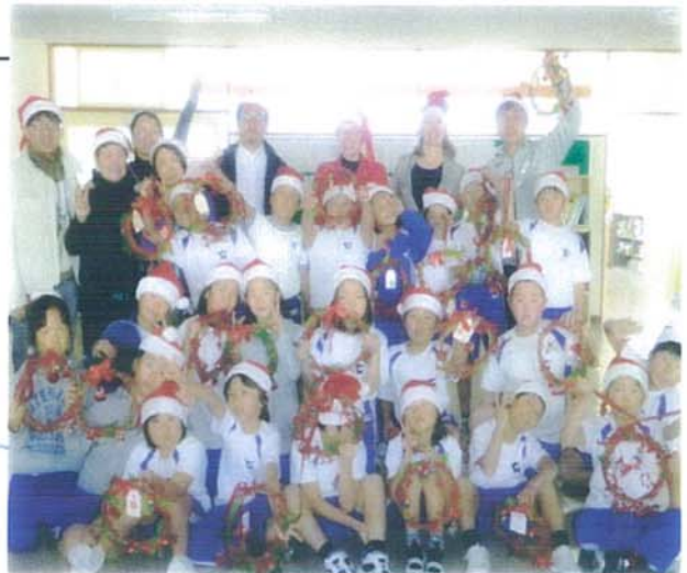
【3年生・ドリーン先生とリース作り】