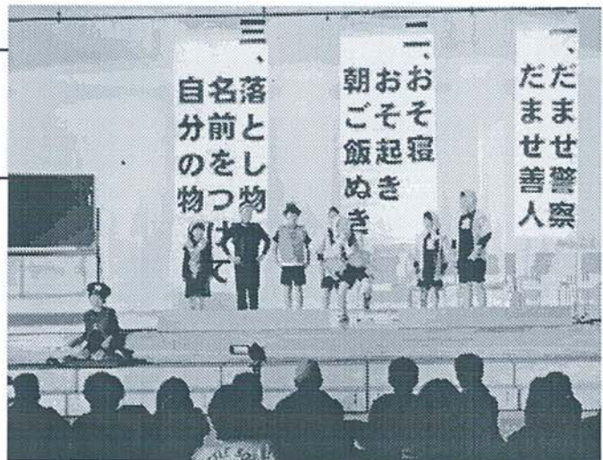
【2年生・学習発表会「どろぼう学校」】

パンジーとキュウリありがとうとうございま ます。パンジーとうえきはちありがとうと うございしました。きゅうりもせん こうにありがとうとうございほ した。おいしくたべることがで きました。