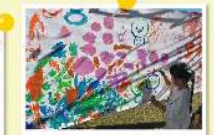
5. 大きなテントに絵を描こう