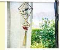
3. 自然素材の雑貨、アクセサリ〜ヒンメリのWS