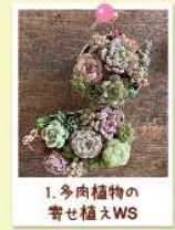
1. 多肉植物の寄せ植えWS