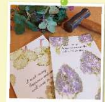
2. 叩き染め植物雑貨