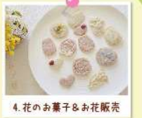
4. 花のお菓子 & お花販売