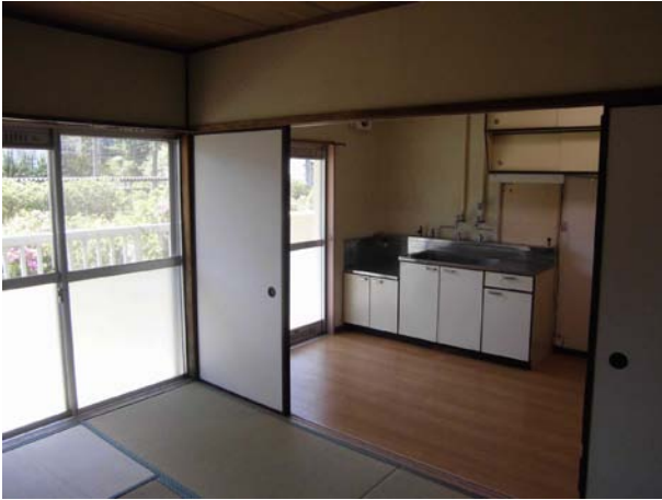
■内観写真（例）第8住宅（3DK）