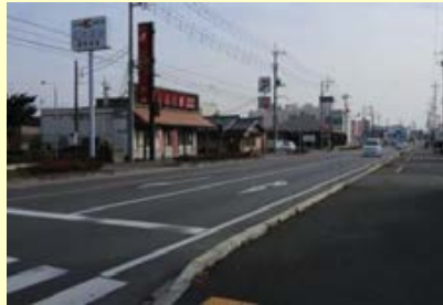
(都) 西部二号線(整備中)