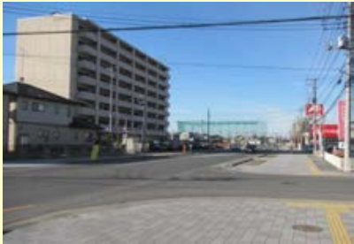
(都) 駅西通り線(整備中)