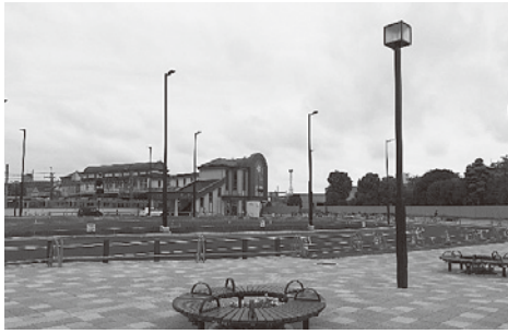
館林駅西口駅前広場

▽館林市駐車場条例Ⅱ館林駅西口駅前広場内に設置する駐車場についての、運用及びその取扱いについて必要な事項を定めるものです。 駐車台数が一般車用31台、身障者用1台、計32台のゲート式コインパーキングの時間貸し有料駐車場を今年度内に整備し、名称を「館林駅西口駅前広場駐車場」として、広場及び駐車場工事の竣工後から供用開始を予定しているものです。 使用料については、駐車開始から12時間までは1時間ごとに100円としますが、駅利用者の利便性を考慮し、