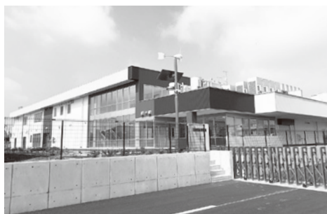
建設中の学校給食センター

▽館林市都市計画税条例の一部を改正する条例Ⅱ地方税法等の一部を改正する法律の施行に伴い、固定資産税と同様に、都市計画税にも適用がある課税標準の特例が改正されたことから所要の改正を行うため、本条例の一部を改正しようとするもので、全員一致で可決されました。