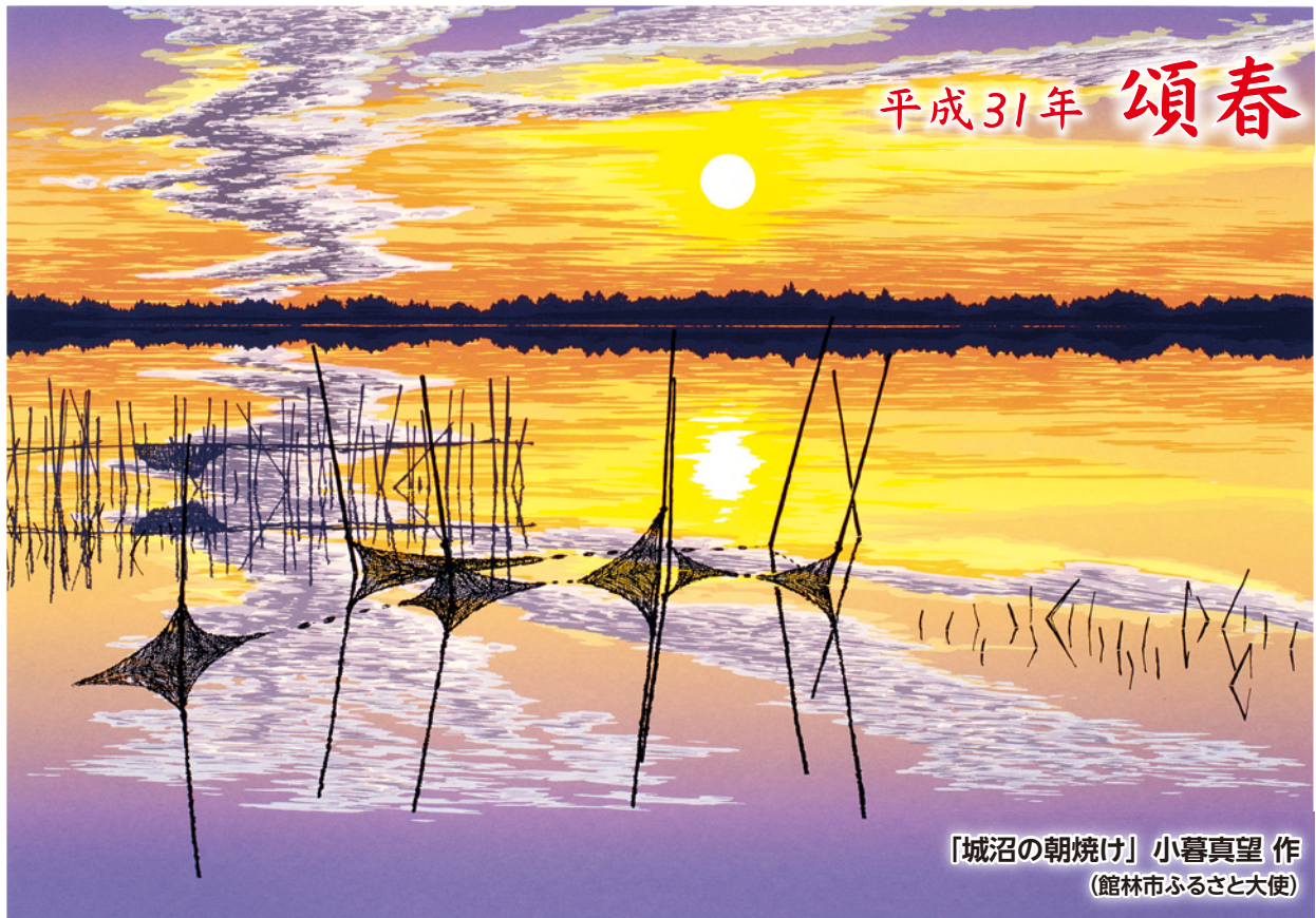
「城沼の朝焼け」小暮真望 作 (館林市ふるさと大使)