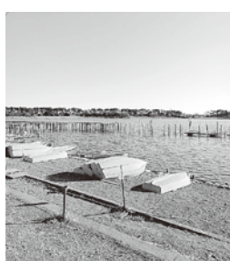
「実りの沼」多々良沼の風景

日本遺産「里沼」観光タク シーとして開始しました。 講習を受けた乗務員がガイ ドをしながら案内する取組 をしています。観光資源や 観光ツアーなど、観光的な ものをつなげて、来客数を 増やし、経済効果を高めて いきたいと考えています。