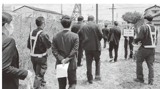
市道 7250 号線の現地調査

査を行った後に審査を行い、採決の結果は、「市道7250号線の路線廃止について」及び「市道7250号