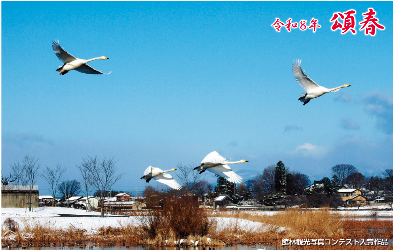
館林観光写真コンテスト入賞作品