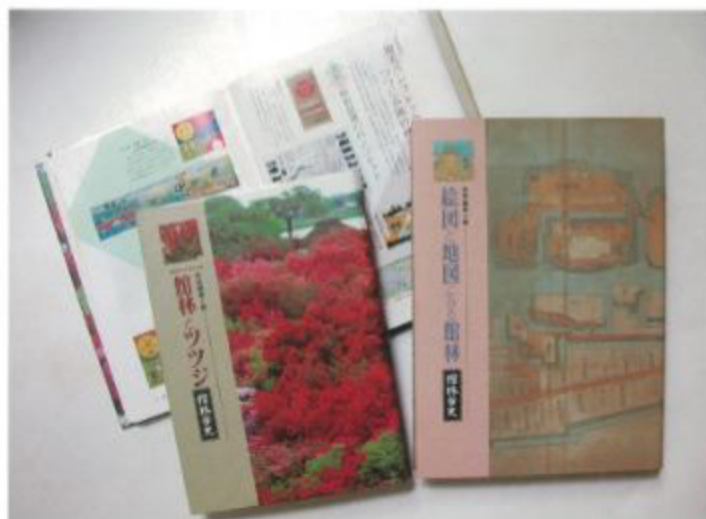
特別編第1巻・第2巻

「館林市史」は、通史編3巻・特別編7巻・資料編6巻の全16巻を刊行する予定です。館林の自然、歴史、民俗などさまざまな分野から、特色ある文化遺産を紹介し、未来へ伝えていきます。